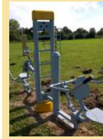
Gmina Czernichów – Utworzenie miejsca rekreacji poprzez budowę siłowni zewnętrznej w miejscowości Kłokoczyn