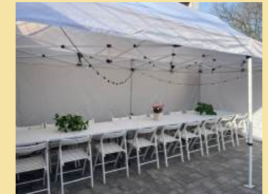
Podjęcie działalności gospodarczej w zakresie mobilnych usług organizacji eventów i imprez plenerowych