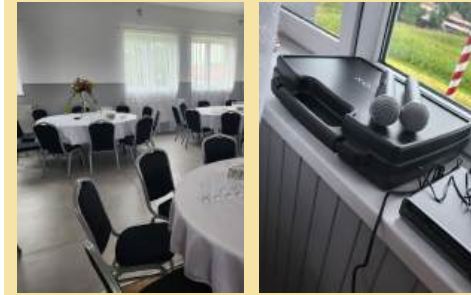
Koło Gospodyń Wiejskich Szlachcianki – Kulturalna Kuźnia Smaku w Nowej Wsi Szlacheckiej – wyposażenie obiektu ogólnodostępnej świetlicy remizy Ochotniczej Straży Pożarnej w Nowej Wsi Szlacheckiej na cele rekreacji kulturalnej w Gminie Czernichów