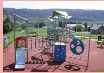
Gmina Zabierzów – Budowa placu zabaw w Niegoszowicach