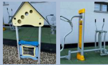
Gmina Świątynki Górne – Siłownia zewnętrzna wraz z zagospodarowaniem terenu w miejscowości Ochojno