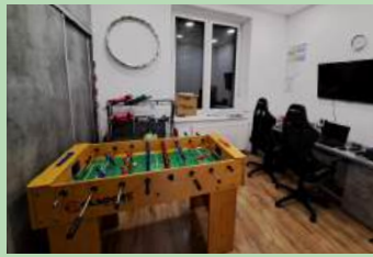
Stowarzyszenie Przyjaciół Grabia – Modernizacja i doposażenie świetlicy wiejskiej w Grabiu