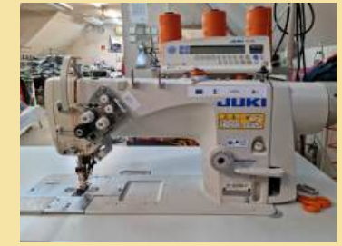
MARABUT Sp. z o.o. – Zwiększenie konkurencyjności firmy MARABUT Sp. z o.o. poprzez inwestycje w nowoczesne urządzenia do produkcji namiotów