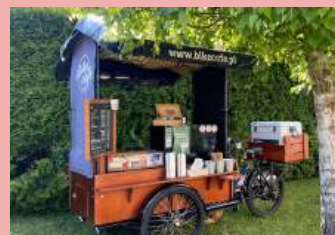
Kamil Pitala Fast-Med – Rozwój działalności gospodarczej o uruchomienie innowacyjnej mobilnej kawiarni