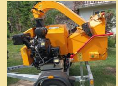
Utworzenie działalności gospodarczej świadczącej usługi wynajmu sprzętu do rozdrabniania gałęzi oraz usług rozdrabniania gałęzi