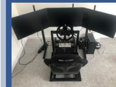
Utworzenie nowego innowacyjnego przedsiębiorstwa – usług nauki jazdy za pomocą symulatora jazdy na obszarze LGD Blisko Krakowa