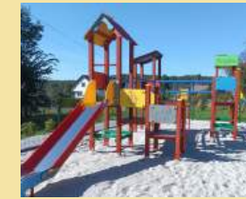
Gmina Czernichów – Budowa otwartej strefy rekreacji w miejscowości Kamień na działkach 361/1, 369/3, 369/8 Gmina Czernichów