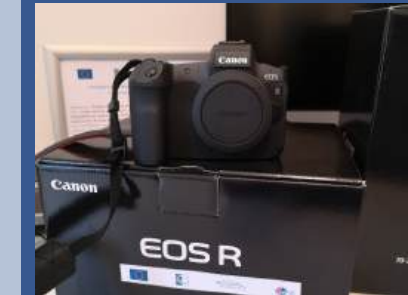
Podjęcie działalności gospodarczej w zakresie usług fotograficznych