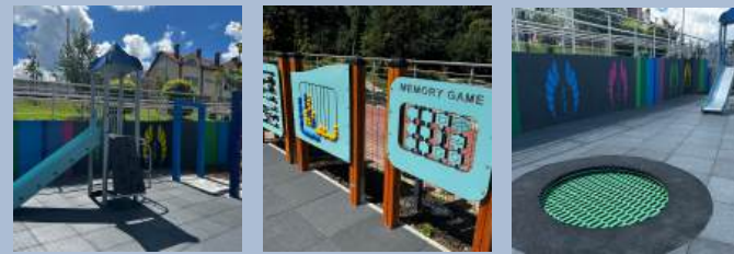
Gmina Świątynki Górne – Budowa elementów małej architektury – plac zabaw – na działkach 160, 161 w miejscowości Świątynki Górne