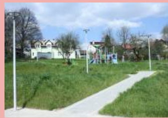
Gmina Zabierzów – Budowa ścieżek spacerowych wraz z oświetleniem na działce w Niegoszowicach