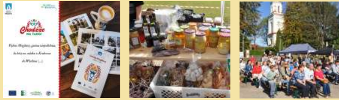
Gmina Mogilany – Skarby Blisko Krakowa – Targ Pietruszkowy i album o Gminie Mogilany